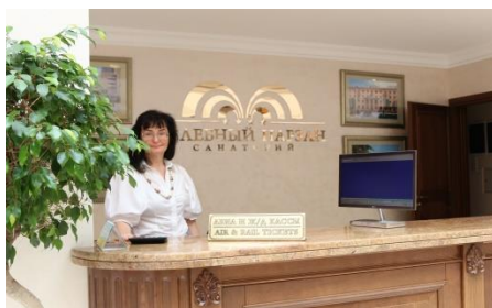
Авиа, ж/д касса